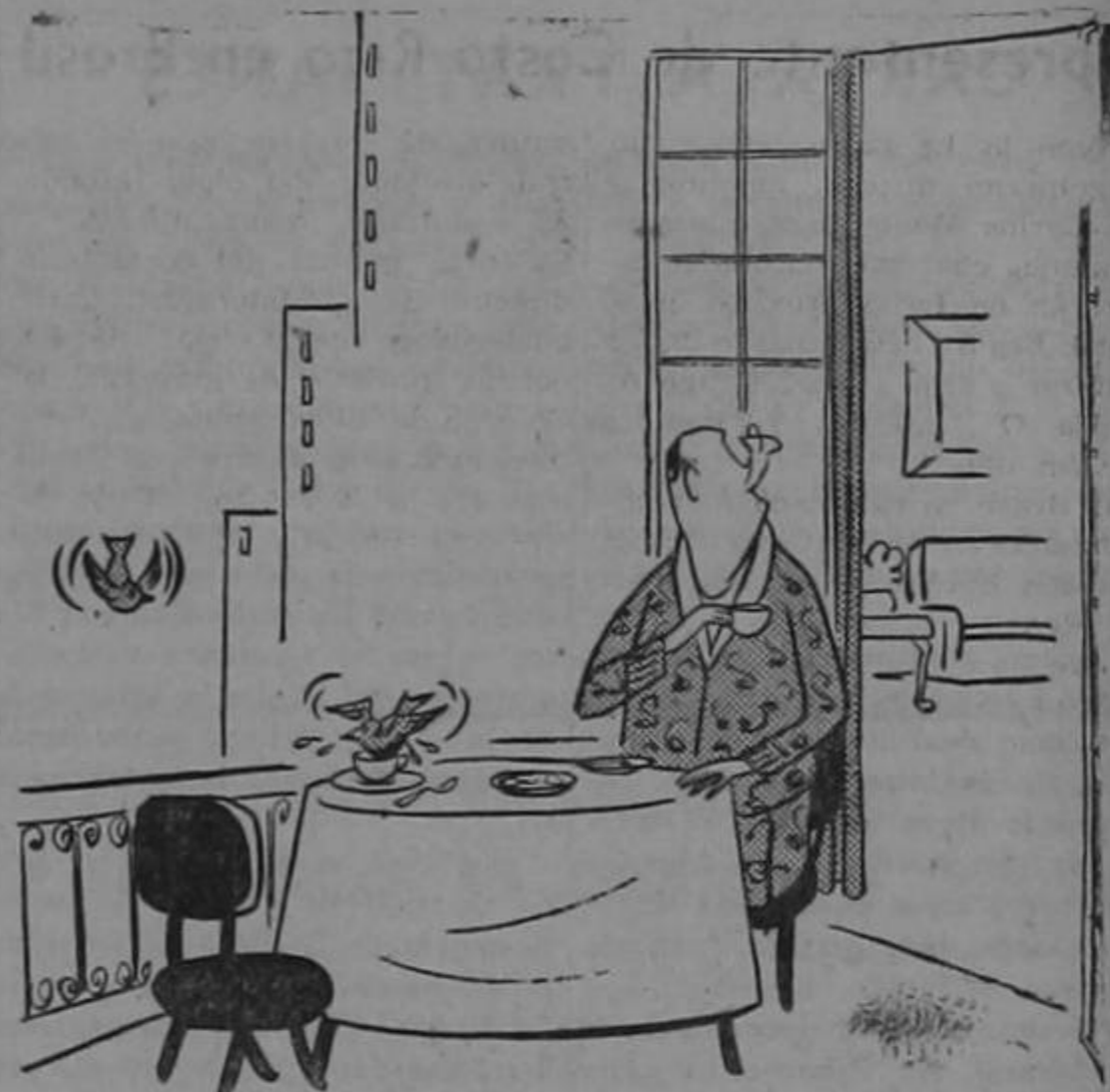
—¡Adelita, corre...! En tu café acaba de caer una palomita...!