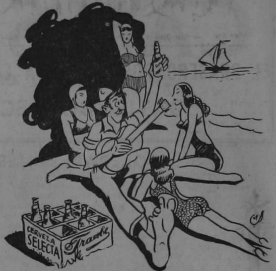
(Chiste de un paseo)